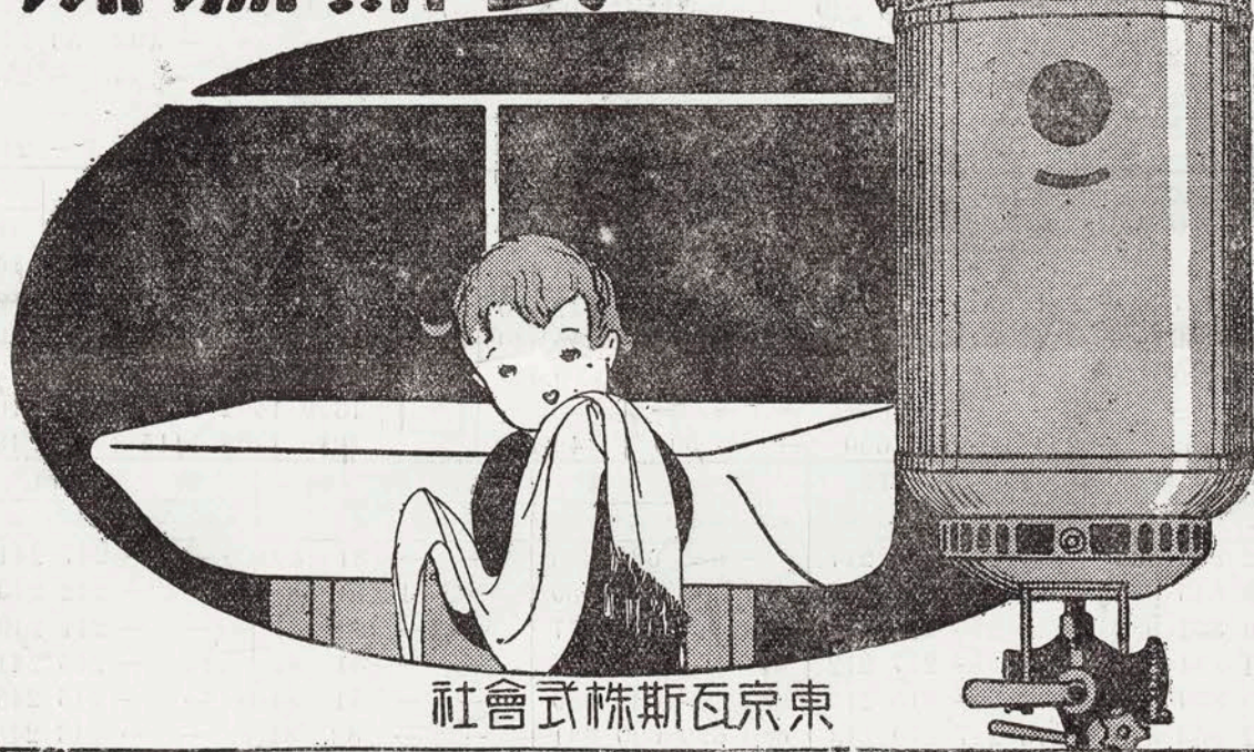
東京瓦斯株式會社